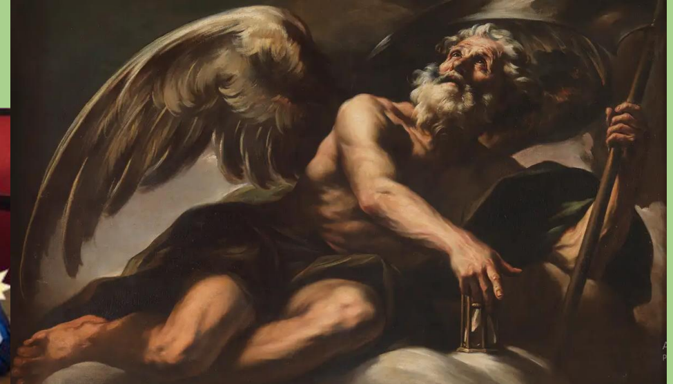
Allegoria del tempo